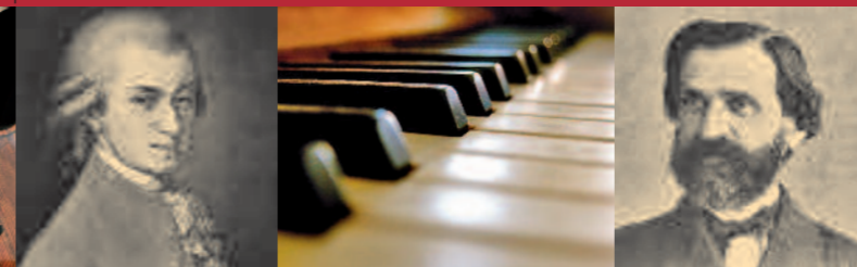
Wolfgang A. Mozart